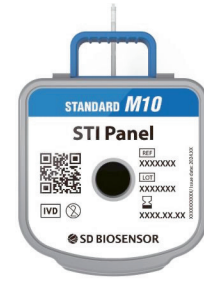
STANDARD™ M10 STI Panel