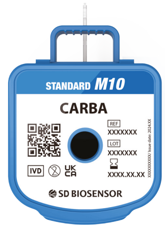
STANDARD™ M10 CARBA