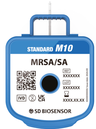
STANDARD™ M10 MRSA/SA